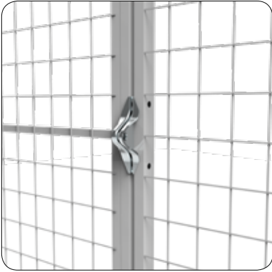
Hänglåskåpa (för F-systemet) - Kan användas på alla dörrar för att skydda hänglåset.