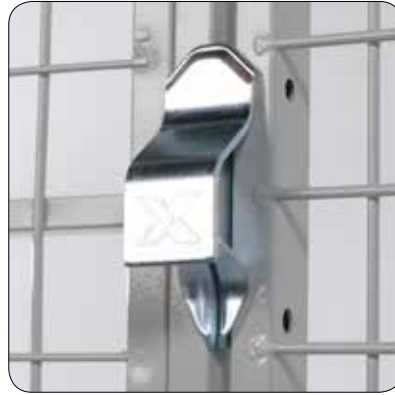
Hänglåskåpa (för FK och FK+) - Kan användas på alla dörrar för att skydda hänglåset. Finns också med extra förstärkt låsbeslag. (se vänster bild)