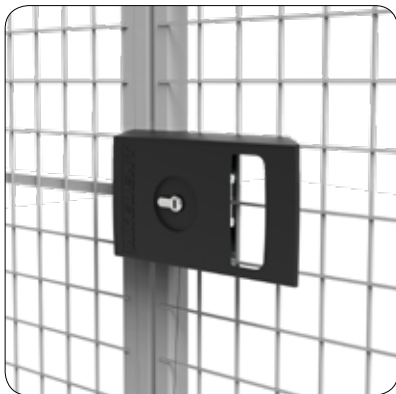
Cylinderlås - För ännu säkrare förråd.