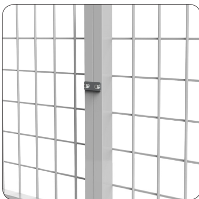
Tvåhålsklammer - Rak.