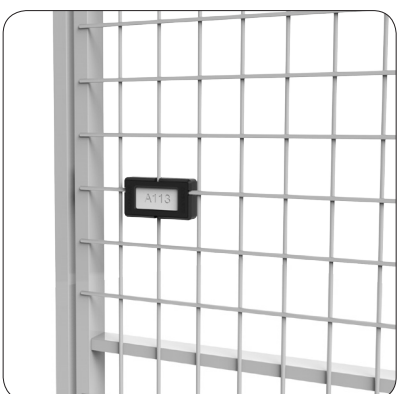
Nummerbricka - Gör det lättare att hitta rätt. Ange önskade nummer så fixar vi detta.