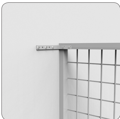
7-hålsvinkel - För infästning mot vägg.