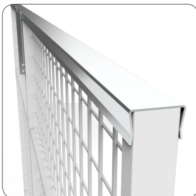
U-profil - Placeras i ovan- och underkant av sektion för stabil konstruktion. (Ej under dörr)