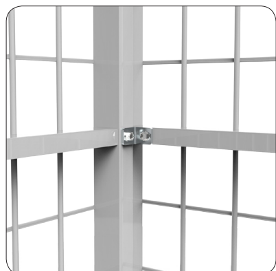
Tvåhålsklammer - Vinklad.